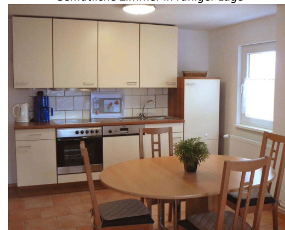
Ankommen, Auspacken und Wohlfühlen