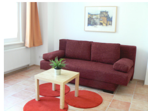
Gemütliche Zimmer in ruhiger Lage