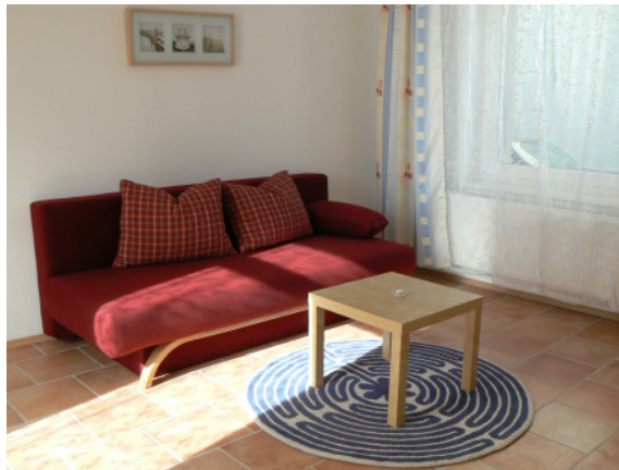
Stilvoll eingerichtete Apartments